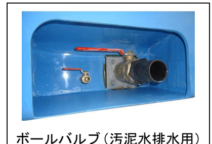
ボールバルブ(汚泥水排水用)