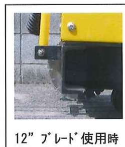
12" ブレード 使用時