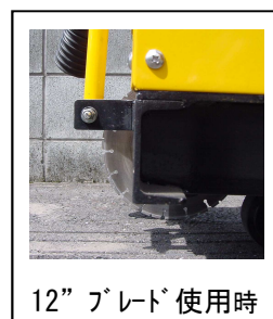
12" ブレード 使用時